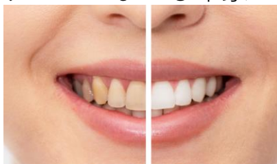
一般的な黄色い歯